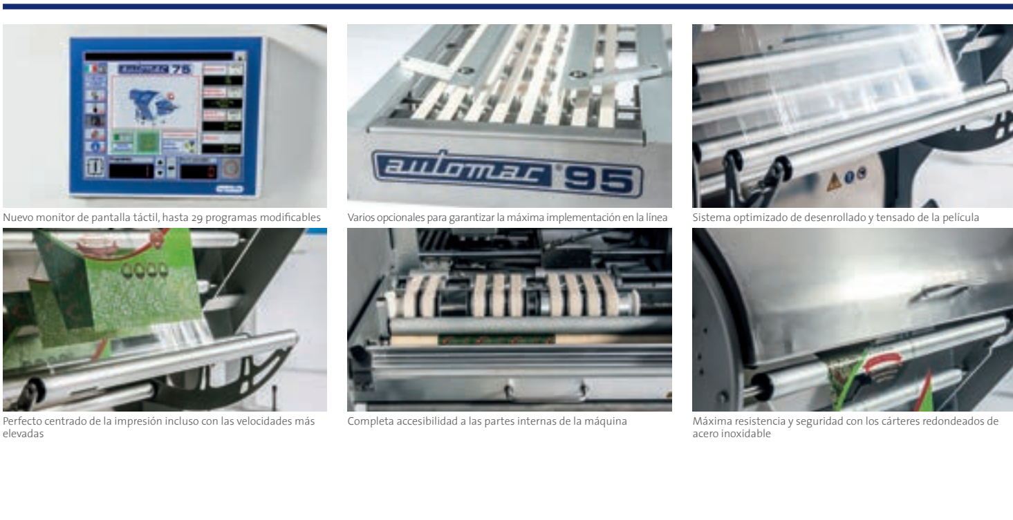
Nuevo monitor de pantalla táctil, hasta 29 programas modificables